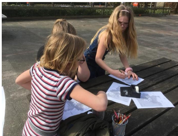
Bewegend leren doen we ook buiten.