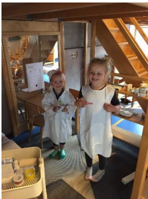
Spelen in de ziekenhuishoek