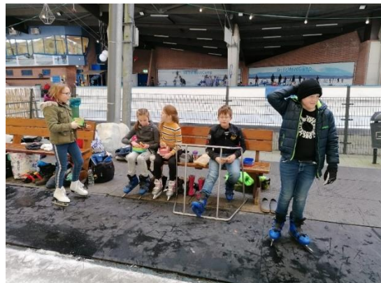
Schaats clinic op de schaatsbaan in Deventer