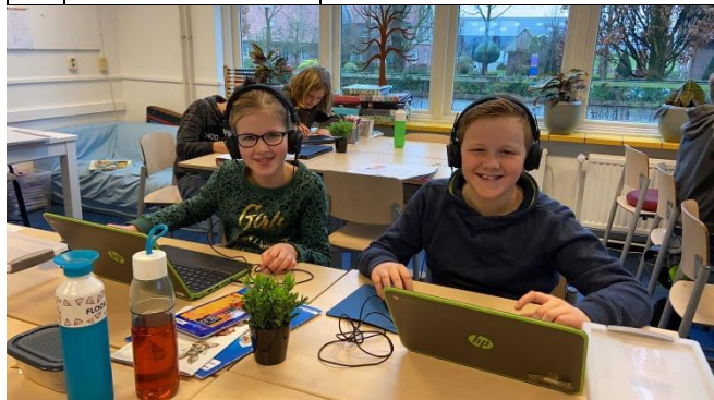
Leerlingen werken digitaal.