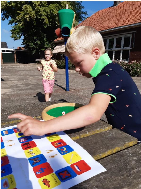
Bewegend leren in groep 3.