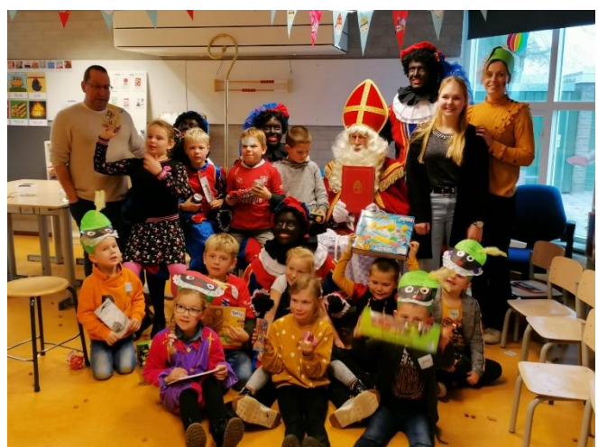
Sinterklaasviering groep 1 t/m 4.