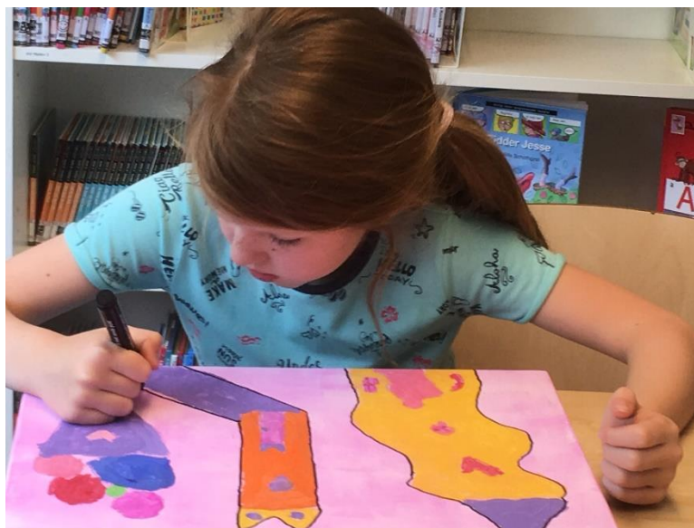
Schilderen tijdens crea-vakken

Net als Oprecht . Leerlingen die oprecht zeggen wat ze denken, voelen en vinden. Naar elkaar en naar de leerkrachten. Dat kan omdat leerlingen elkaar onvoorwaardelijk accepteren. Dat doen wij als leerkracht ook. Wij zijn oprecht geïnteresseerd naar de persoon achter de leerling. Wat houdt je bezig en waarom doe je wat je doet? Noem het nieuwsgierig, noem het betrokken maar wij staan voor onze waarden.