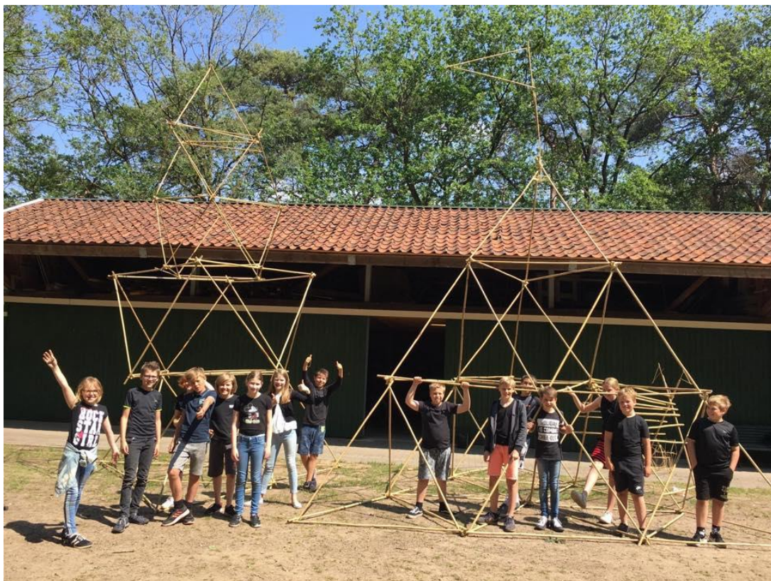
Torens bouwen in de Kusterskoele met de 'Veldtocht'

In het jaar 2019-2020 is er i.v.m. coronacrisis geen eindtoets Cito afgenomen. De eindscore CITO 2018-2019 op onze school was 528,0. (535,7 landelijk gemiddeld.)