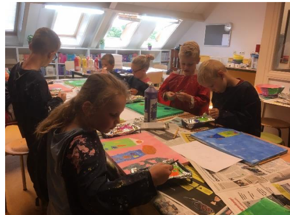
Schilderen tijdens crea