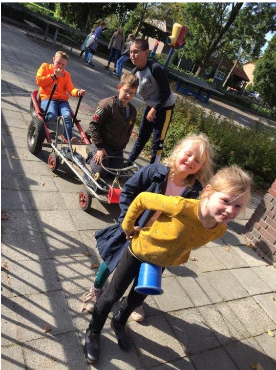
Buiten spelen we allemaal samen

Als u hier onvoldoende tevreden over bent, kunt u een klacht indienen bij de klachtencommissie. (zie adressenlijst)