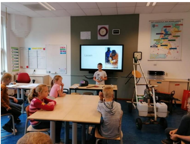
Presenteren in de klas.

Verlof dat wordt genomen zonder toestemming van de directeur of leerplichtambtenaar wordt gezien als ongeoorloofd verzuim. De directie is verplicht om dit aan de leerplichtambtenaar te melden. Deze beslist of er al dan niet proces-verbaal wordt opgemaakt