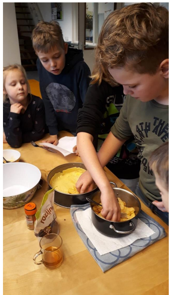
Begrijpend lezen inzetten bij het bakken van appeltaart.