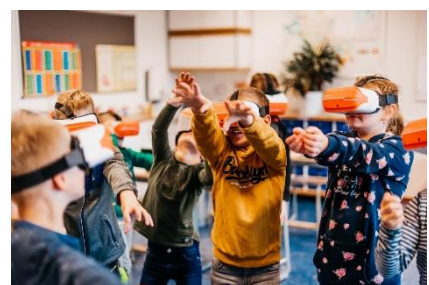
Ontdekkend leren met behulp van VR-brillen

Dat geldt ook voor nieuwsgierig trouwens. Want we willen nieuwsgierige kinderen. Dat stimuleren we op alle manieren. Kinderen mogen zien, horen, voelen proeven en ruiken. Zo leren ze op allerlei manieren. Maar vooral met heel veel energie. Niet passief aanhoren maar actief en nieuwsgierig als basishouding! Mooi he?