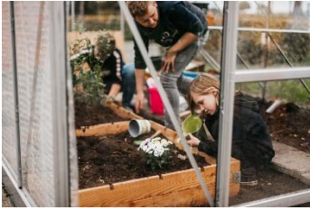
Leren in de moestuin